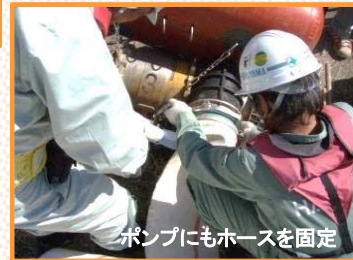
ポンプにもホースを固定

1台で毎分30m 3 の排水能力を持ち、25mプールの水を10分ほどで空にすることができます。