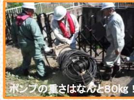
ポンプの重さはなんと80kg!

当日は、機器の取扱いについて確認した後、グループに分かれて、ポンプやホースの設置訓練等を行いました。中でもホースの接続作業は少しコツがいるようで、参加者の皆さんは金具を締める力加減などを確認しながら何度も練習していました。