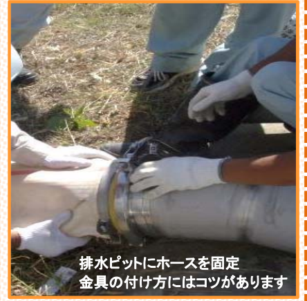
排水ピットにホースを固定 金具の付け方にはコツがあります