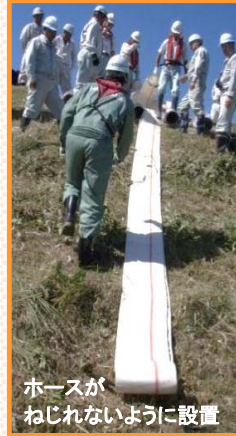
ホースがねじれないように設置