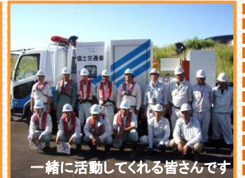
一緒に活動してくれる皆さんです

いざという時に備え、人命や財産を守るため「迅速かつ的確に」排水活動ができるように努めていきます。