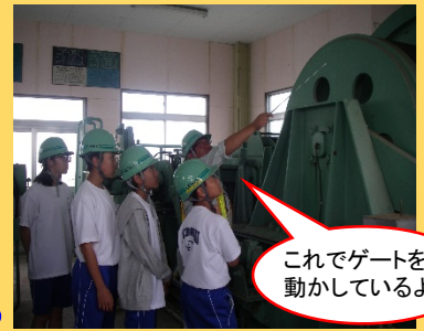
巻き上げ機の説明