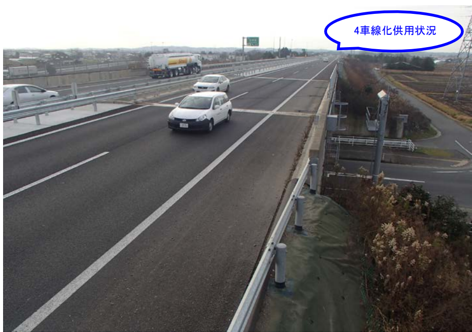
③ 終点側から起点側を望む