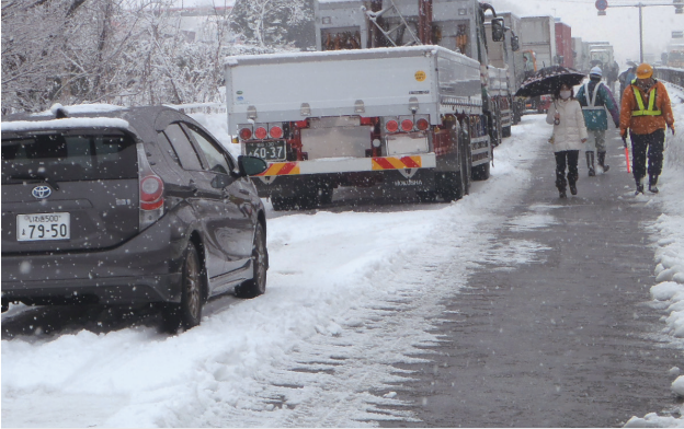
平成26年2月 国道4号 福島市 スタック発生による車両滞留