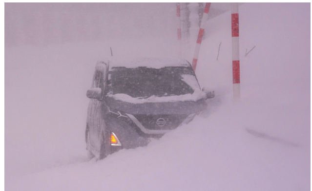
令和4年2月 国道13号 福島市 雪壁への衝突事故