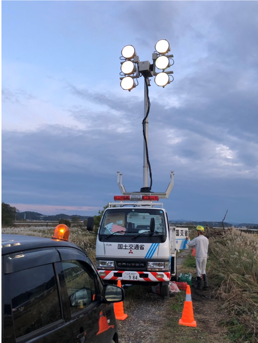
照明車活動状況（場所：福島県岩瀬郡鏡石町）