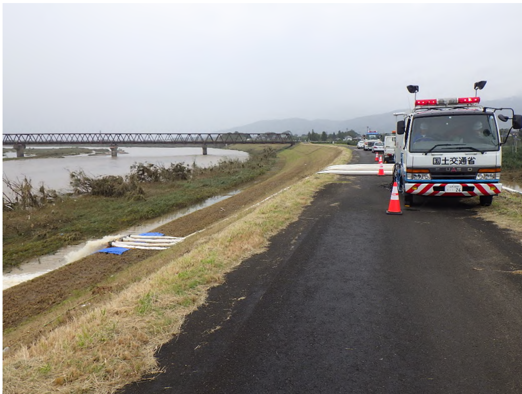
排水ポンプ車活動状況①（場所：福島県伊達郡国見町）