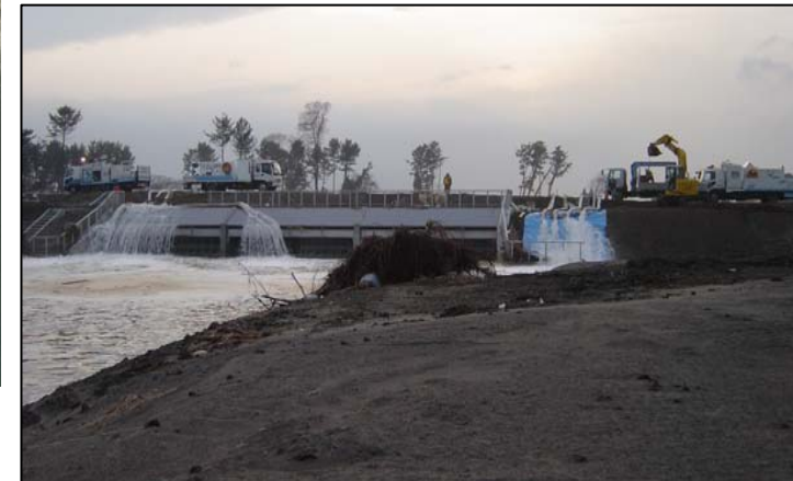
排水作業状況(9日17時30分撮影)

排水ポンプ車(排水能力:30m 3 /分)を3台投入 ※1時間に、25mプールで約13個分の水を排水します