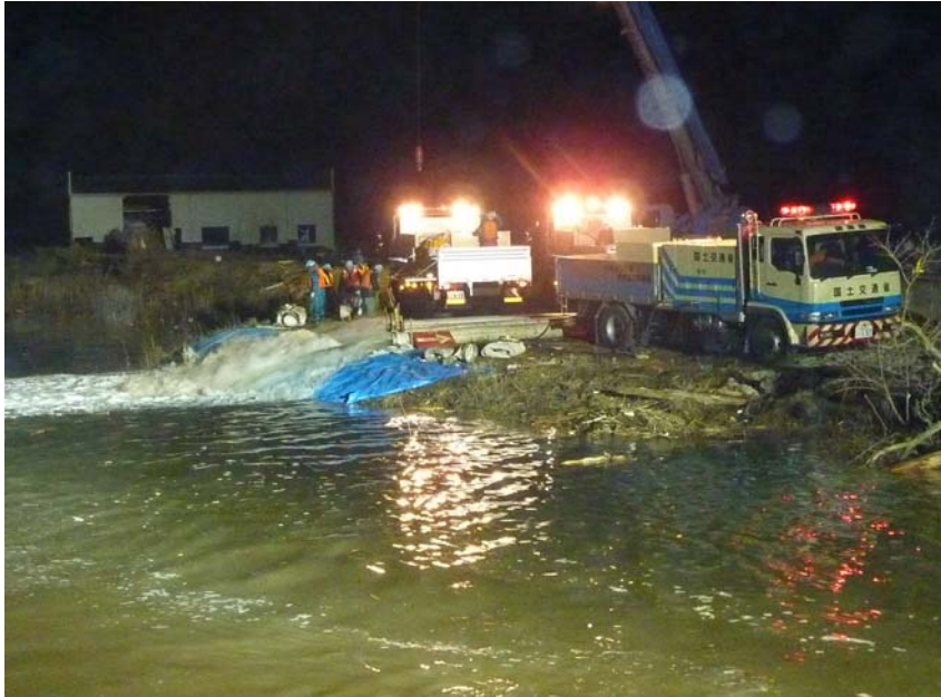
3月29日22時頃 排水ポンプ車による北上川への排水状況 (60m 3 /m 3台)