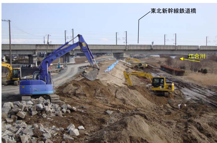
3月19日堤防亀裂・沈下の復旧盛土