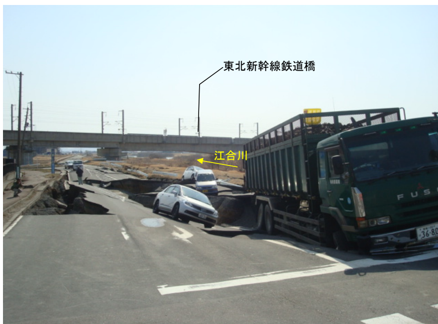
3月11日堤防被災状況 堤防亀裂・沈下