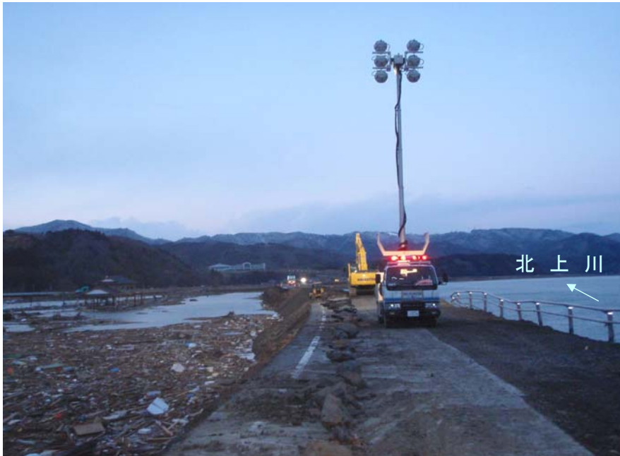
3月17日18時頃 荒締め切り作業状況