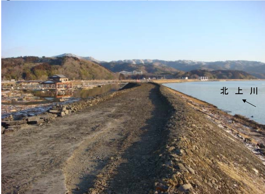
3月18日6時頃 荒締め切り作業状況