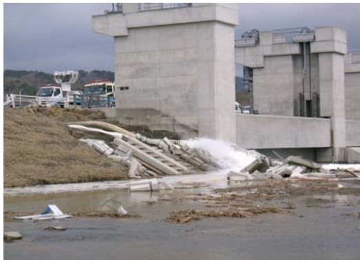
⑥石巻市北上町十三浜(3月15日)