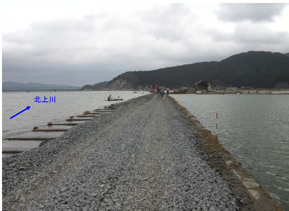
平成23年3月15日11時頃 工事用道路設置完了