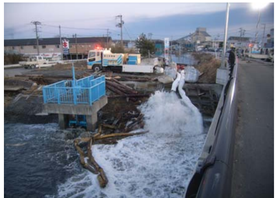
②石巻市釜閘門(3月12日)