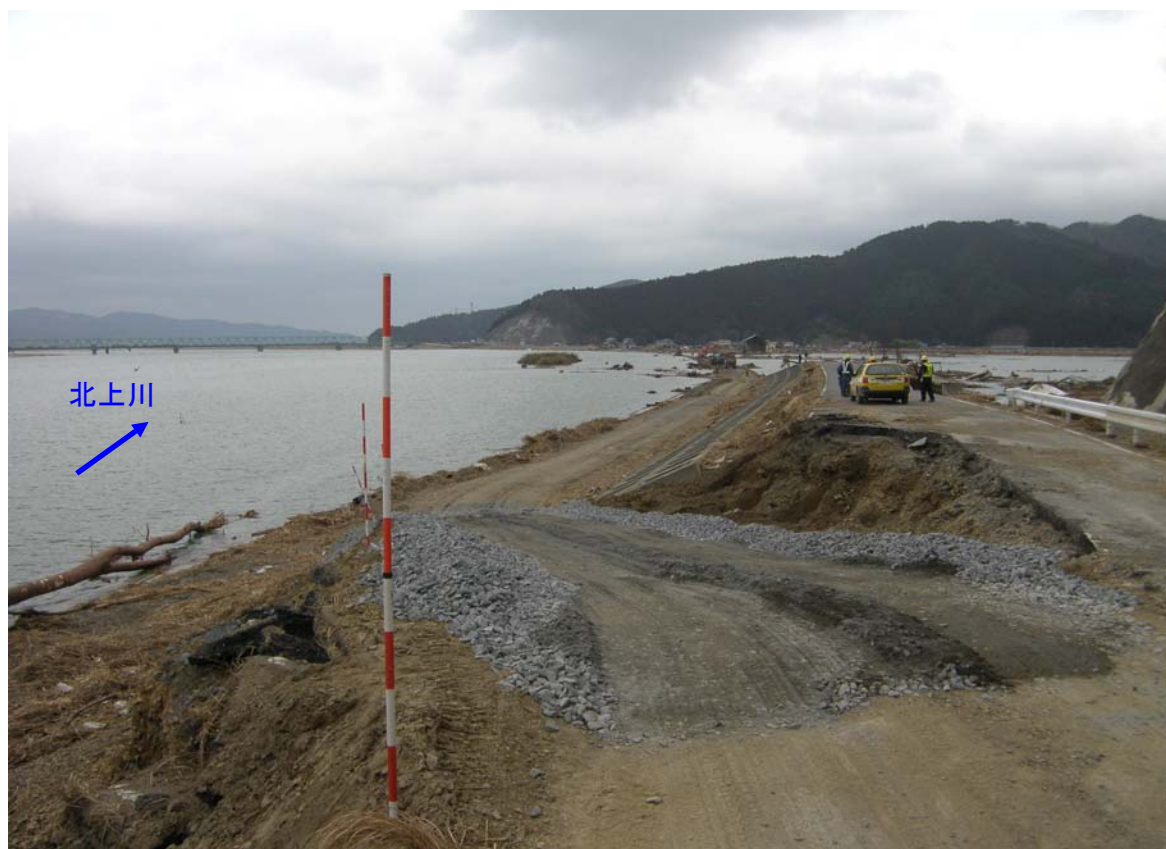
平成23年3月15日11時頃 工事用道路設置完了(上流側)