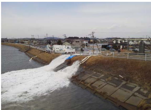
③東松島市赤井(3月14日)