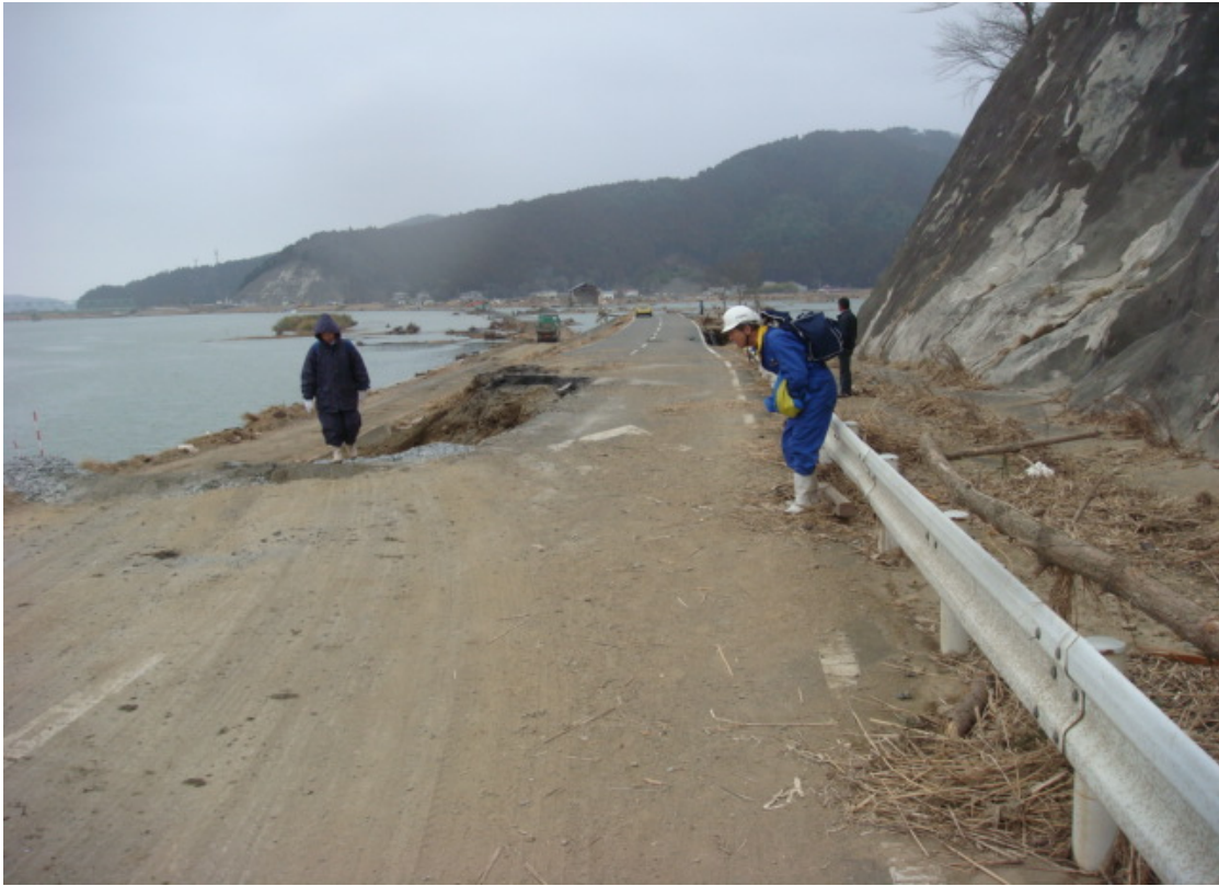
平成23年3月15日14時頃 道路完成により下流から、被災者2名が避難。