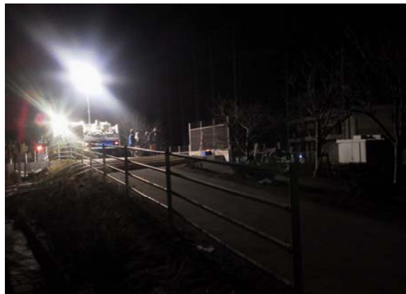
④石巻市工業高(3月14日)