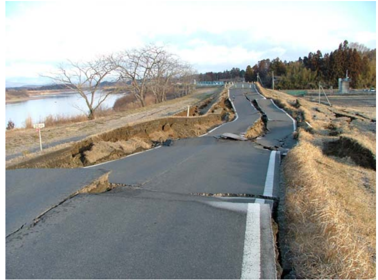
写真② 堤防沈下 (河口から右岸22.0k付近 角田市坂津田地先)