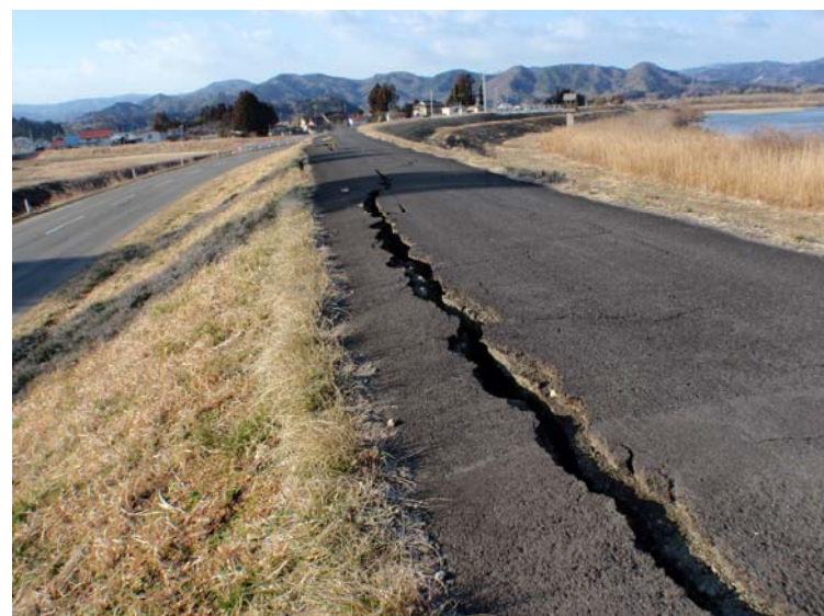
写真③ 堤防縦断亀裂(クラック) (河口から右岸31.0k付近 角田市堂畑地先)