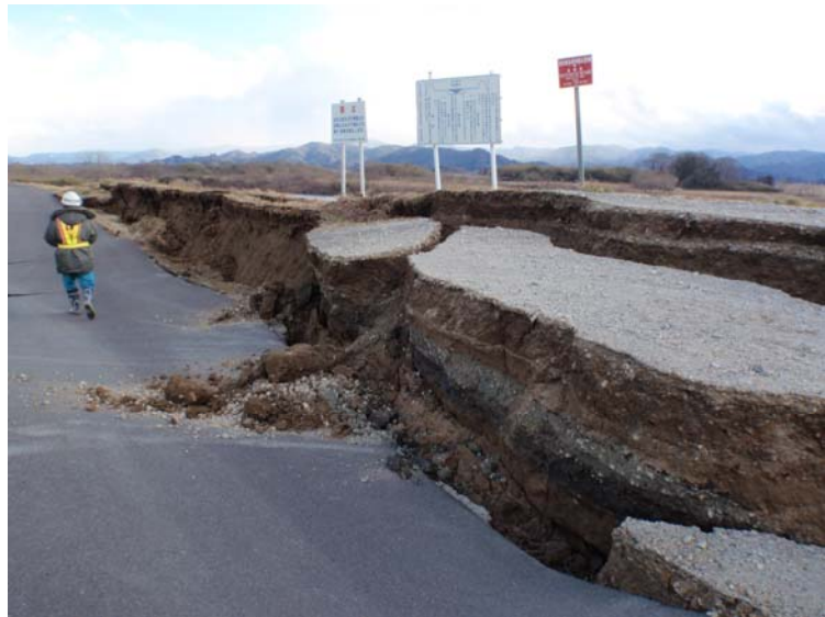
写真① 堤防沈下 (河口から右岸31.0k付近 角田市堂畑地先)