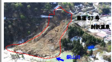
平成 24 年 大規模な地滑り性の斜面崩壊