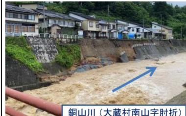
令和 2 年 7 月豪雨 護岸の流出