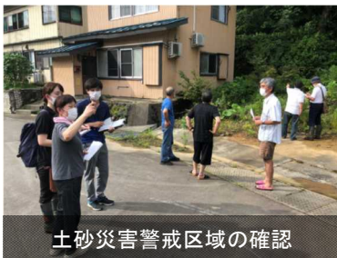
土砂災害警戒区域の確認

地域住民が実際に外に出て歩きながら、土砂災害警戒区域等の位置や避難場所、避難経路、過去に災害のあった箇所、整備されている砂防施設などを確認するものです。また、実際に現地を歩くことで、ハザードマップなどには書かれていない、住民が危険だと思う場所や、避難所までの経路・避難時間などについて、地域住民が共通の認識を持つことにも繋がります。