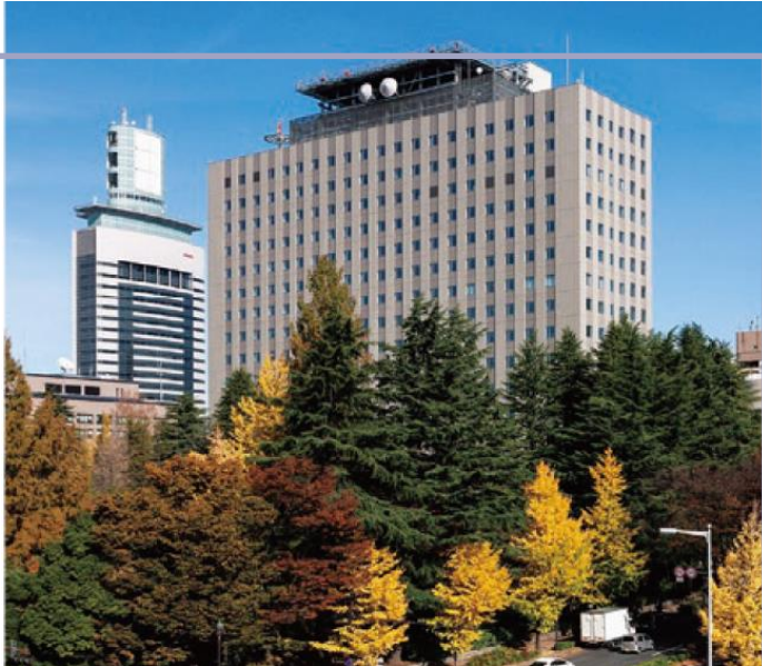
▲東北地方整備局(仙台合同庁舎B棟)

青森県、岩手県、宮城県、秋田県、山形県、福島県を管轄し、道路、河川、ダム、砂防、港湾、空港施設等の整備及び維持管理、建設業や不動産業の許認可に関する業務等を実施。