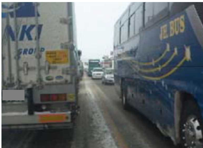
【写真②】 今回開通する区間(福島側を望む)