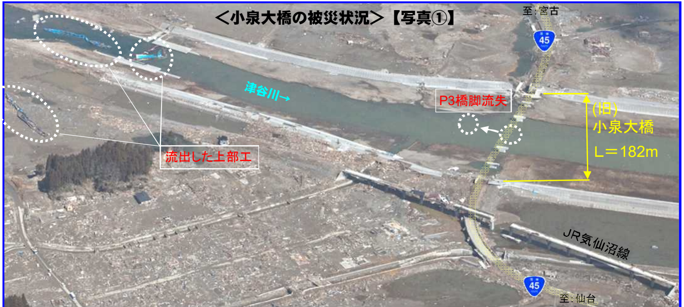
＜小泉大橋の被災状況＞ 【写真①】

○国道45号気仙沼市本吉町の津谷川に架かる小泉大橋は、平成23年3月11日の東日本大震災の津波により流出しました。（写真①）下流側に仮橋を設置（写真②）し、新たに橋を架け替える工事を行っていましたが、橋及び前後の道路整備が進み、令和2年1月25日（土）午後9時頃に新しい橋に交通を切り替えます。（写真③）