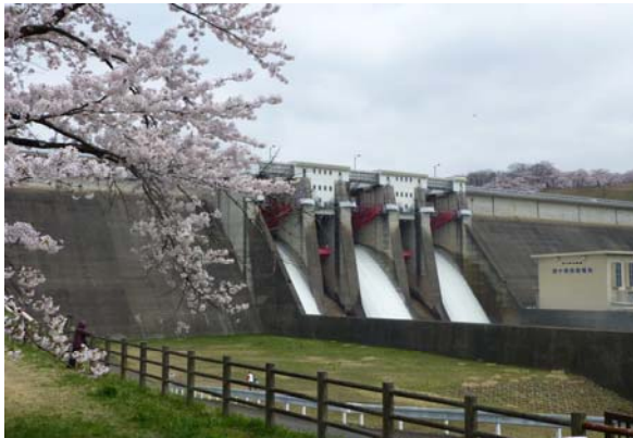
四十四田ダム クレストゲートからの放流