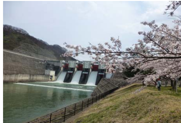
御所ダム クレストゲートからの放流