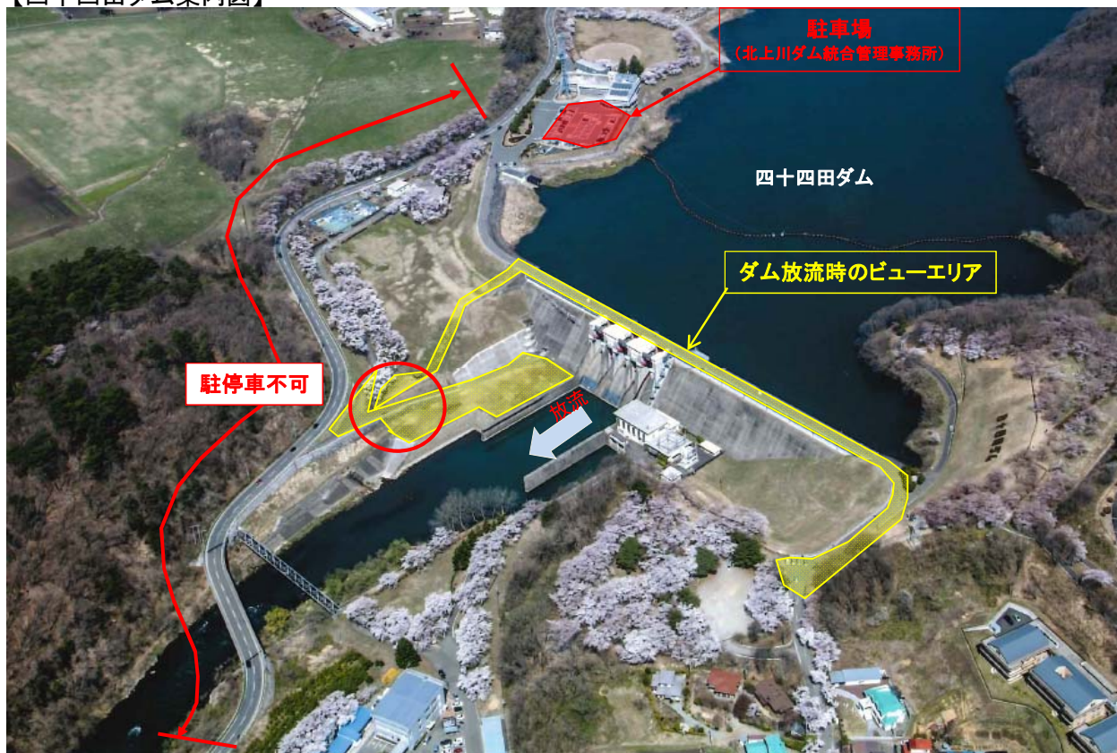
【四十四田ダム案内図】