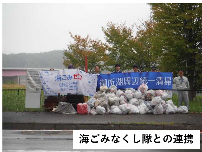
海ごみなくし隊との連携