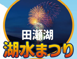
田瀬湖 湖水まつり