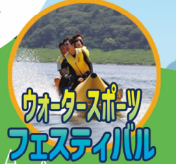
ウォータースポーツ フェスティバル