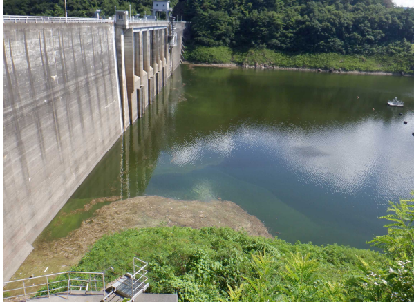
① 令和6年8月頃撮影(ダムサイト付近)