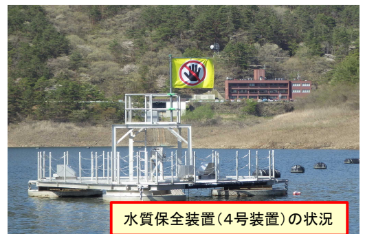
水質保全装置(4号装置)の状況