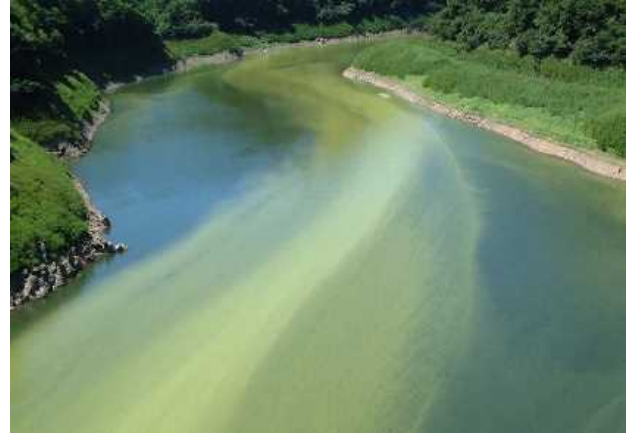
② 平成12年9月頃撮影(田瀬大橋付近)