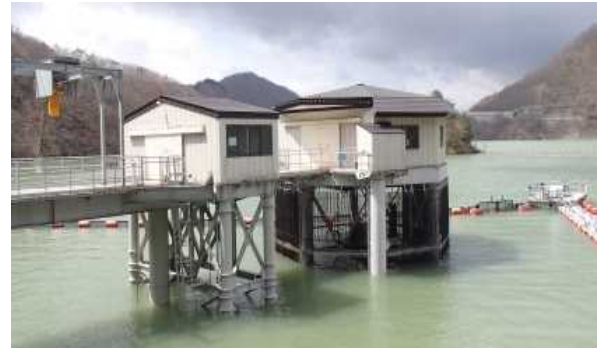
連絡トンネルの先にある発電取水塔