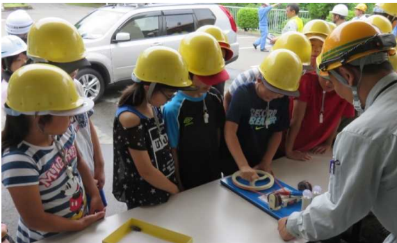
発電おもちゃ体験