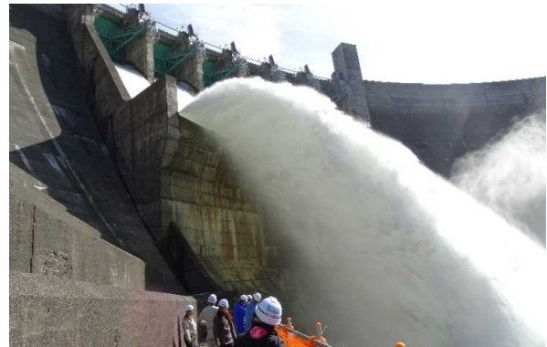
特別見学エリアからの眺め

※②「宿泊者見学プラン」と「JR北上線利用プラン」では、特別見学エリアからの見学ができます。