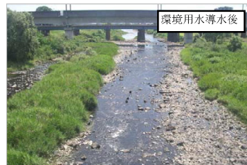
環境用水(0.4m 3 /s)導水後のイメージ