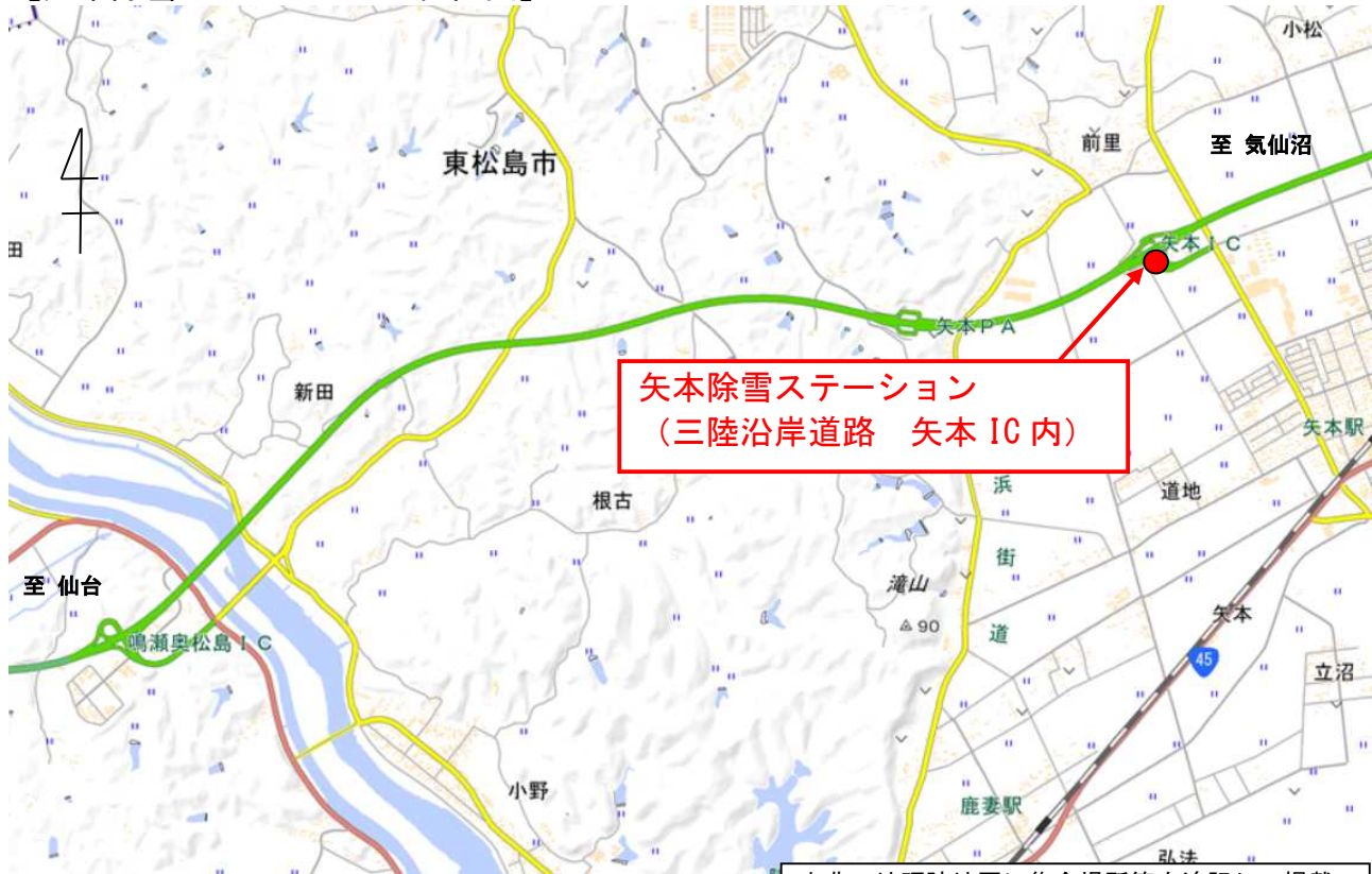
【矢本除雪ステーション 位置図】