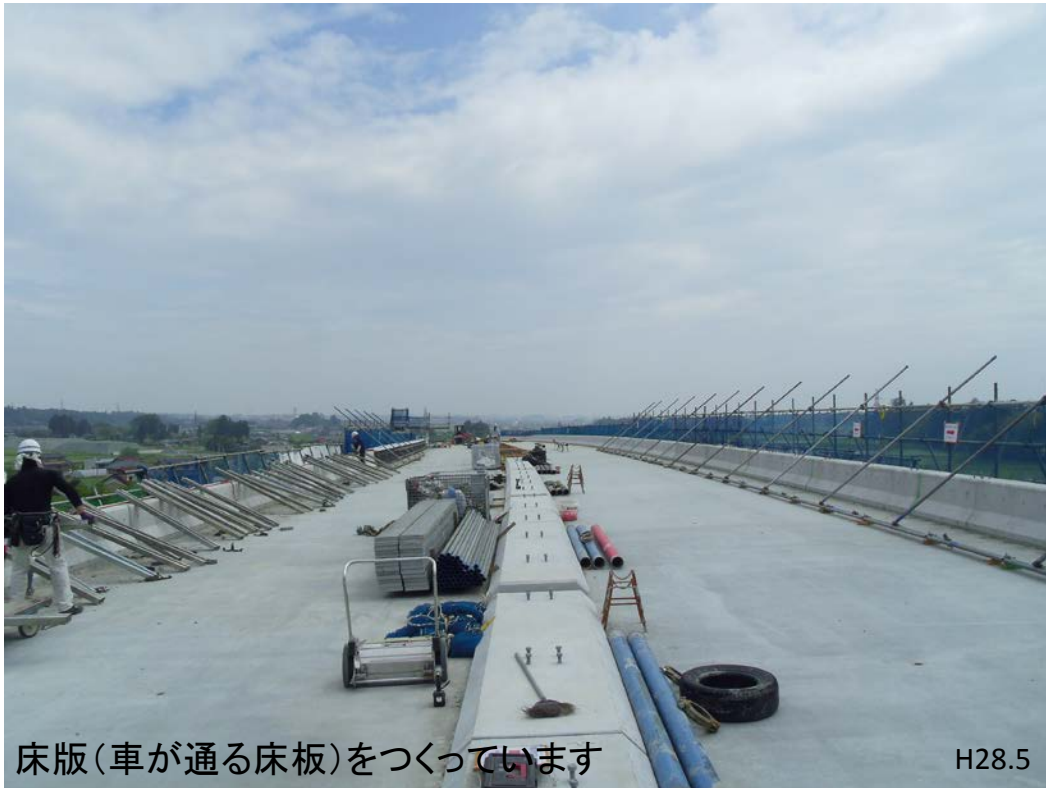
床版(車が通る床板)をつくっています