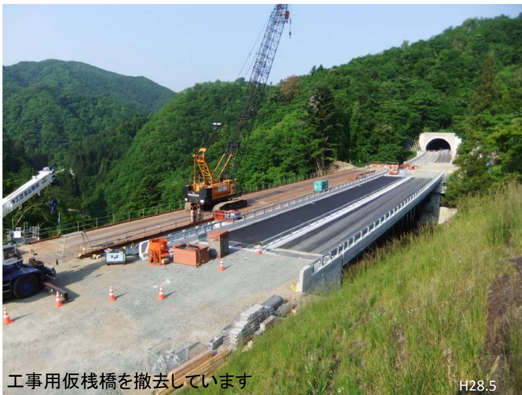
工事用仮棧橋を撤去しています