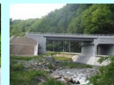
うたがわばし 宇多川橋