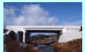
たまのがわばし 玉野川橋