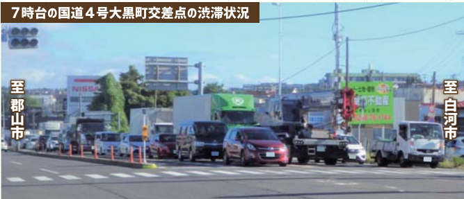
7時台の国道4号大黒町交差点の渋滞状況