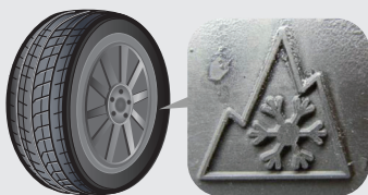
(タイヤの側面に表示されています)