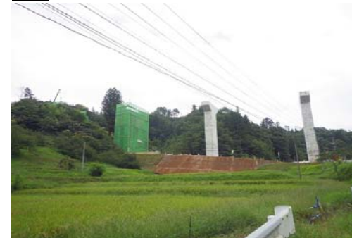
4 めのかわ 布川大橋