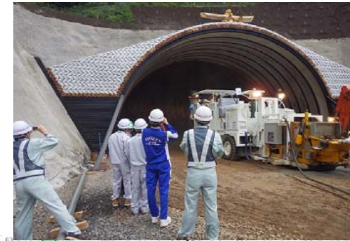
7 しょうじぶち 庄司淵ンネル