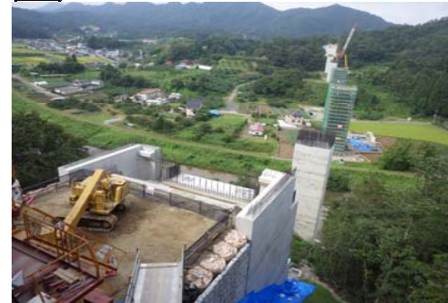
2 つきだて 月館高架橋