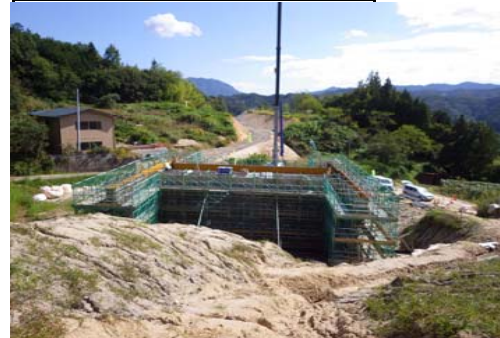
みよた 御代田地区