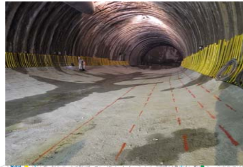
2 まだてやま 馬館山トンネル