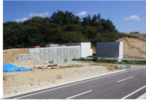
1 みよた 御代田こ道橋