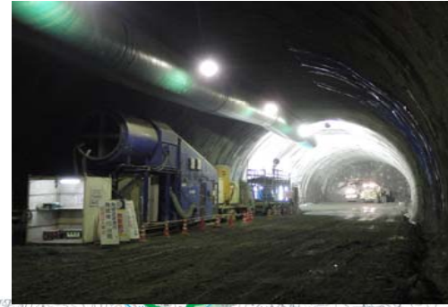
3 ななつくぼ セツ窪トンネル