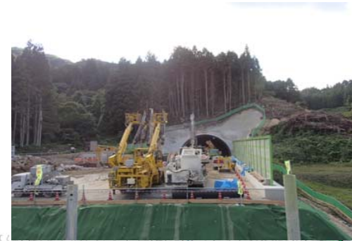
6 こしめぐり 腰巡トンネル