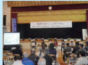
シンポジウムの開催