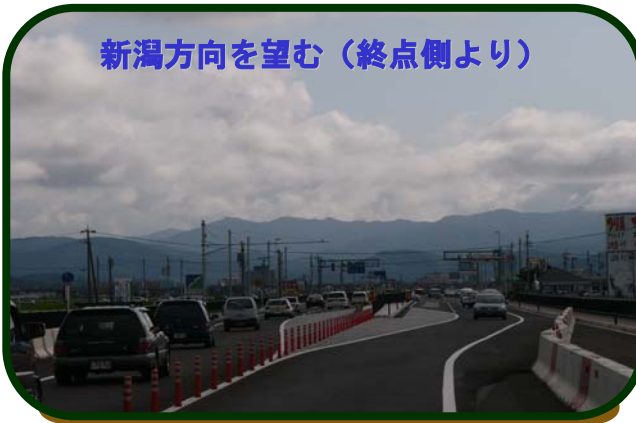
新潟方向を望む（終点側より）