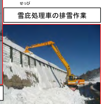
せっぴ 雪庇処理車の排雪作業