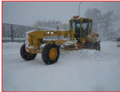
除雪グレーダーの路面整正作業

月山道路では、冬期間でも安全に通行できるため、24時間体制で除雪作業を行っています。各種の除雪機械を使用し作業を行っていますが、特に除雪グレーダーは低速走行で作業を行います。適宜待避し通行を確保しますので、後続のドライバーの皆様は、追い越しはせず車間距離を保ちながら運転下さい。また、天候・路面状況に応じ、片側交互通行で排雪作業を行っている場合があります。誘導員の指示に従っていただき、スピード控えめにご通行下さい。冬期間の交通確保のため、ご理解とご協力をよろしくお願いします。