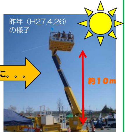
昨年 (H27.4.26) の様子