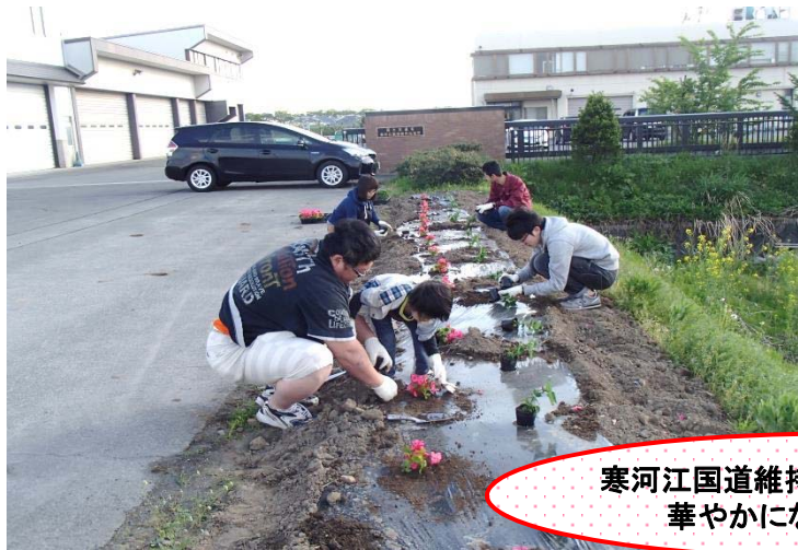
寒河江国道維持出張所の入り口前も 華やかになりました(^_^)♪