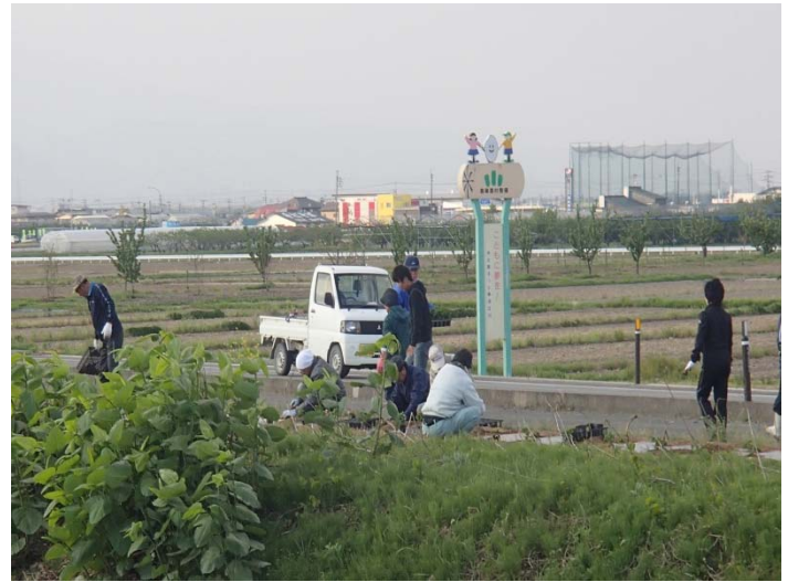
早朝から大変おつかれさまでした<(_ _)> 元気に育つと良いですね！