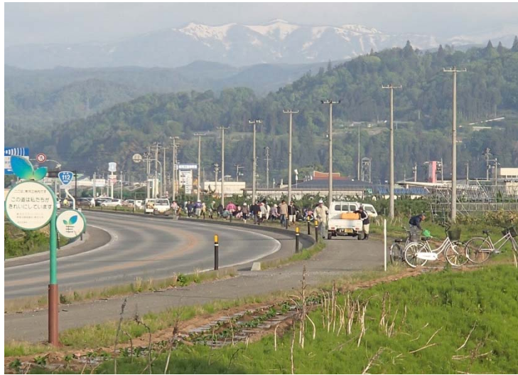
市民の皆さんが協力しあって、 沢山の苗を植えました。