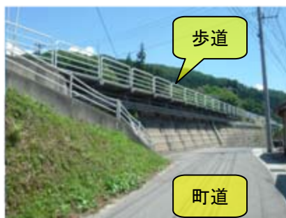
町道から見た全景