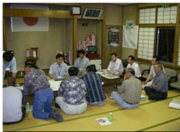
▲▼住民説明会の様子