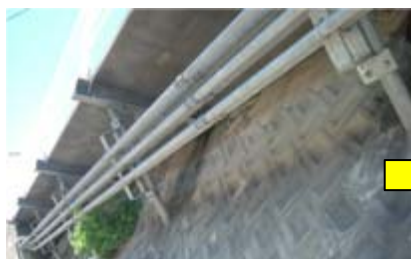
歩道の下はこんなふうになっています(左) 組立歩道解消イメージ(右写真は他箇所の事例)