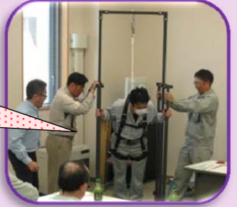
5月 フルハーネス安全帯の体験を行いました!

この通信紙は、梨郷道路の工事状況を皆様に分かりやすくお伝えできるように、米沢監督官詰所で作成しています。『こんな事が知りたい!』『あれってなあに?』など、知りたいことや疑問に思うことがありましたら、お気軽にご連絡ください。 道路が完成するまで、僕が紹介するよ。よろしくね!