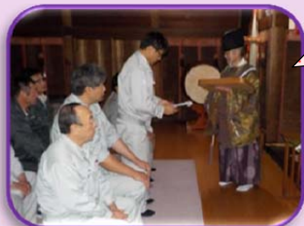
4月 工事安全祈願祭の様子(米沢市白子神社にて)

工事請負業者を会員として安全協議会を発足し、1年間安全に工事が進められるように月1回協議会を開き、各現場から安全訓練の報告や安全に関する指導を行います。