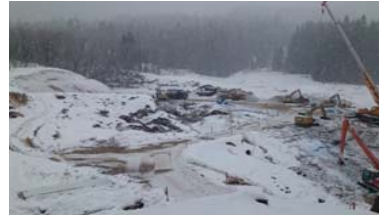
前波地区(酒田方面)