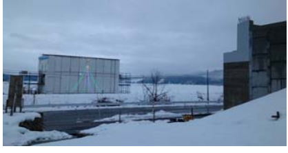
津谷跨線橋付近(新庄方面)