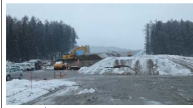
升形地区(新庄方面)