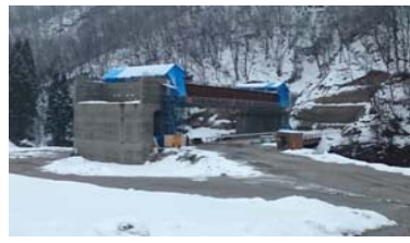
升形4号橋(酒田方面)