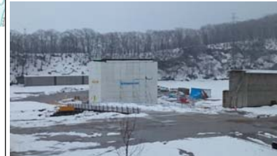
升形3号橋(新庄方面)