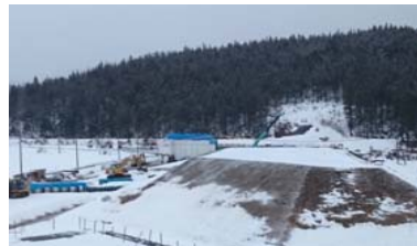
岩清水地区(新庄方面)