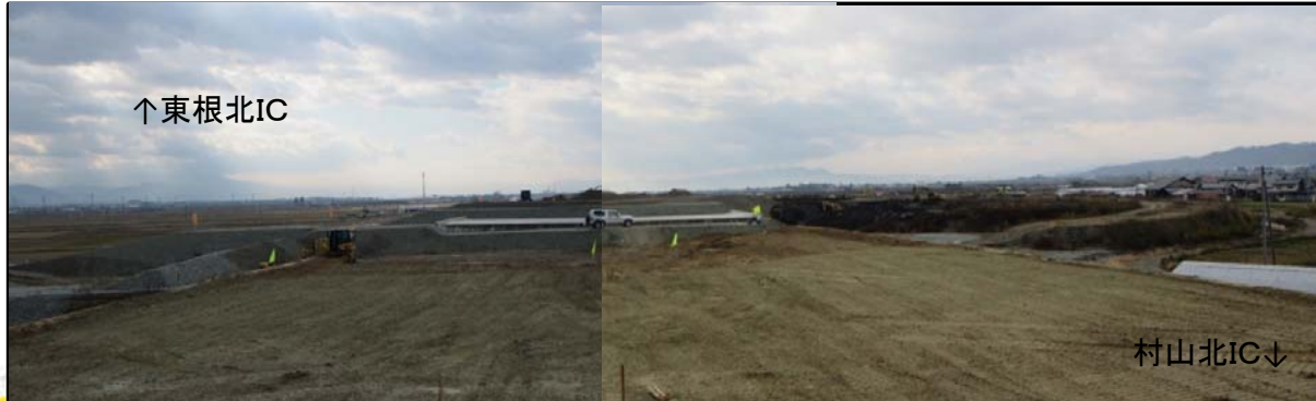
村山IC(仮称) (山形方向)