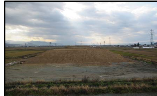
浮沼地区 (山形方向)