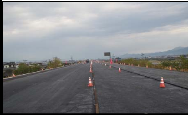
羽入地区(新庄方向)