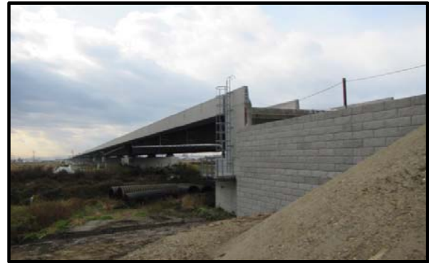
西郷高架橋A2側(山形方向)