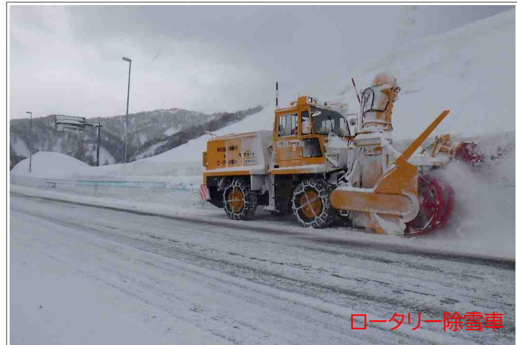
ロータリー除雪車