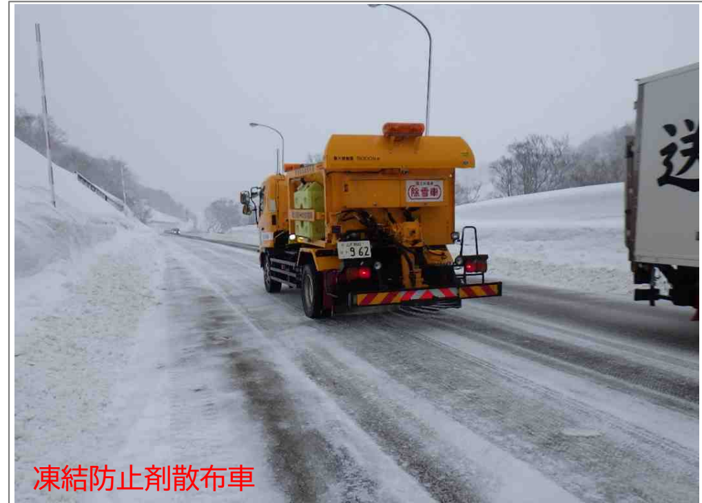
凍結防止剤散布車

路面凍結時、グレーダーによる除雪後に一般車両のスタックなどが起こらないような凍結防止剤散布を心掛けたいと思います。