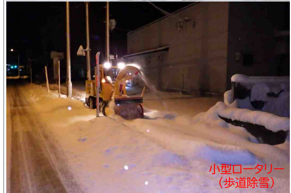
小型ロータリー (歩道除雪)