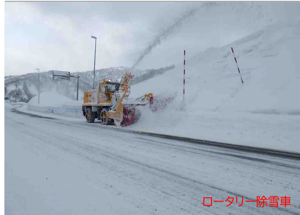
ロータリー除雪車