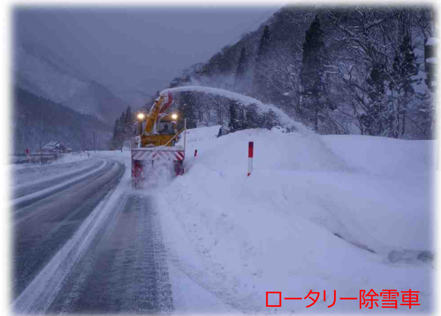
ロータリー除雪車