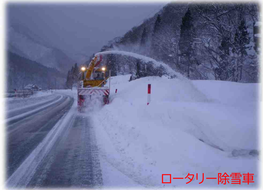
ロータリー除雪車