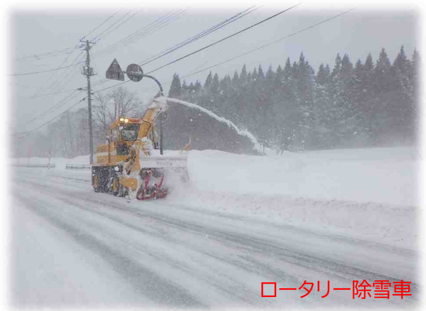
ロータリー除雪車