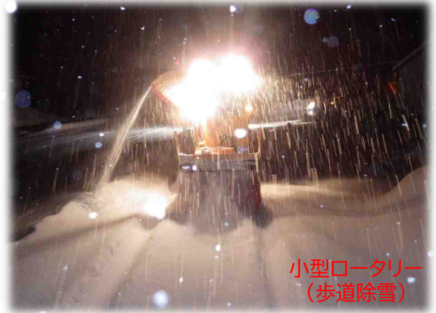
小型ロータリー (歩道除雪)