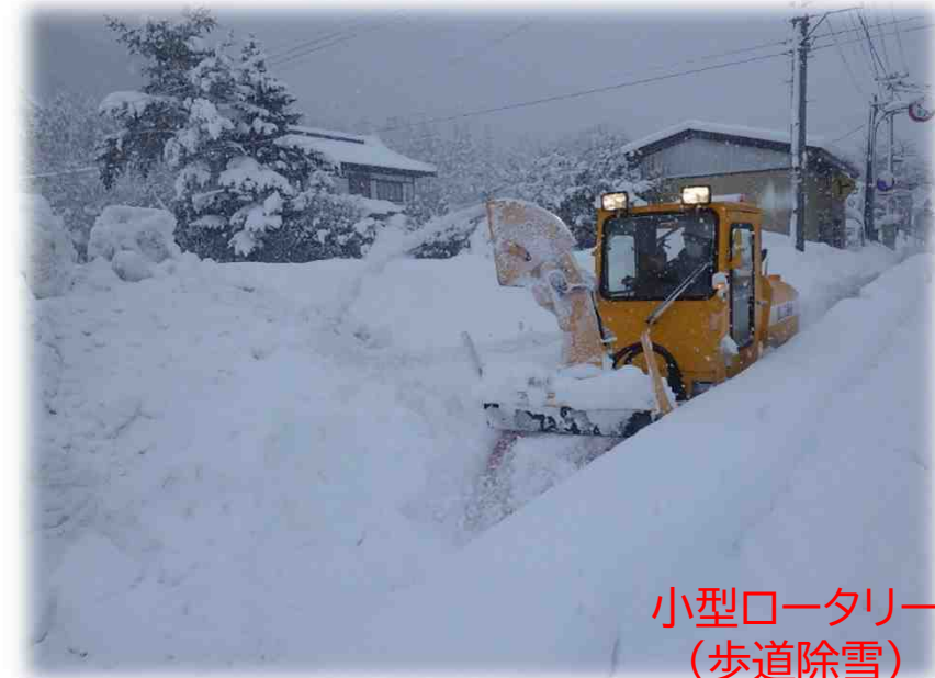
小型ロータリー (歩道除雪)