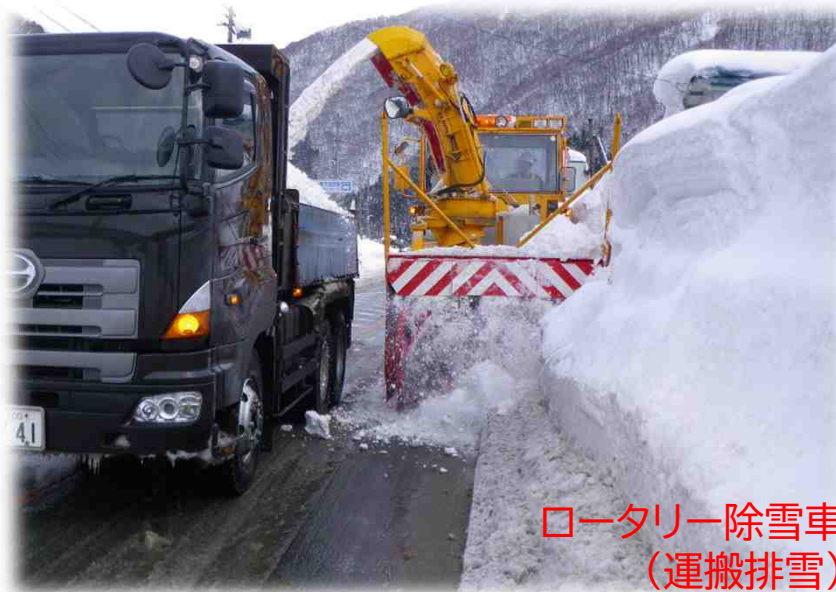
ロータリー除雪車 (運搬排雪)