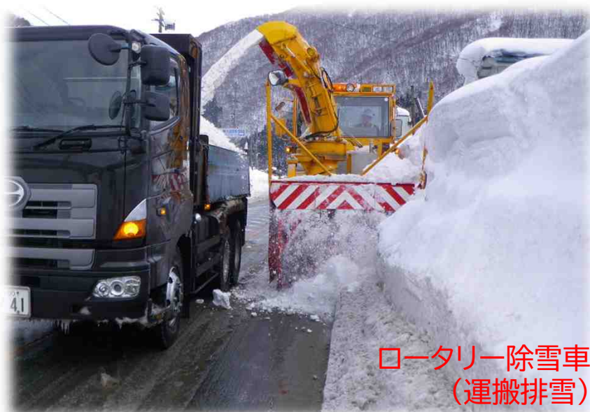
ロータリ除雪車 (運搬排雪)