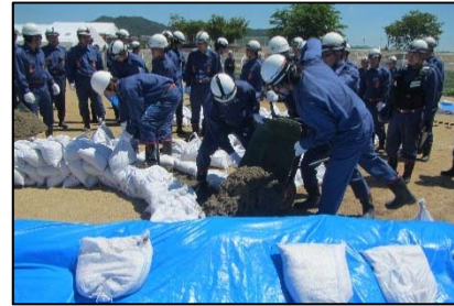
水防団による水防訓練状況(南陽市)