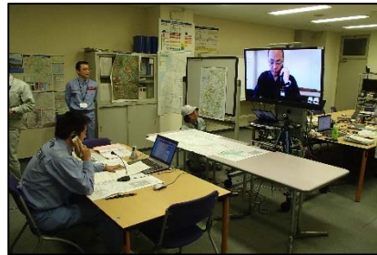
ホットライン訓練状況(山形河国)