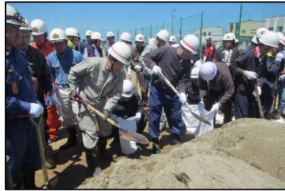
住民自らによる水防訓練状況(南陽市)