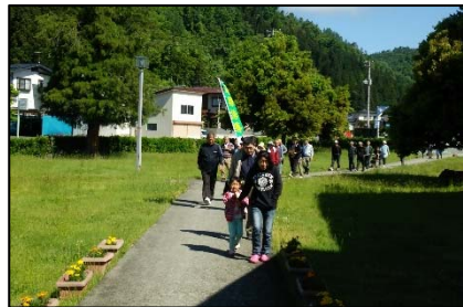
住民による避難訓練状況(南陽市)