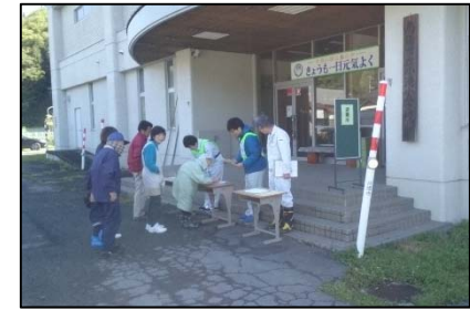
住民による避難訓練状況(南陽市)