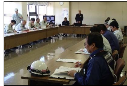
災害対策本部員会議状況(南陽市)