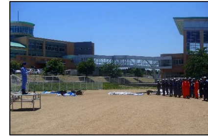
水防訓練参画状況(山形河国)