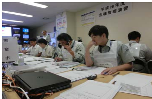
統監部(要配慮者利用施設役)