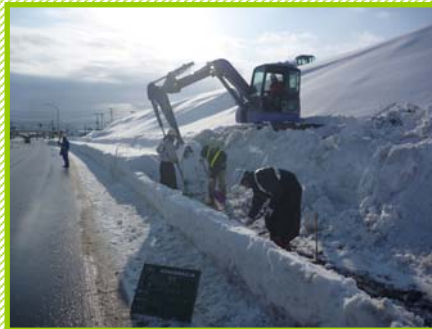
…立入防止柵を施工する場所の除雪中…