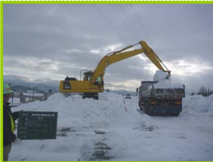
…工事用道路の除雪中…

除雪した雪が置ききれない場合は、ダンプに積み込んで現場内の空いているスペースへ運びます。