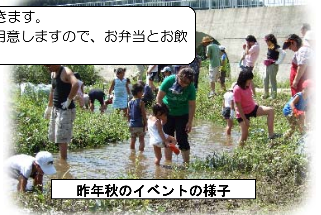
昨年秋のイベントの様子