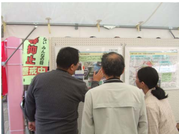
☆ 湯沢で堰を改築しています ☆

お客様だけでなく、屋台や「たんせ市」の関係者の方々からも「おいしい」と好評でした。