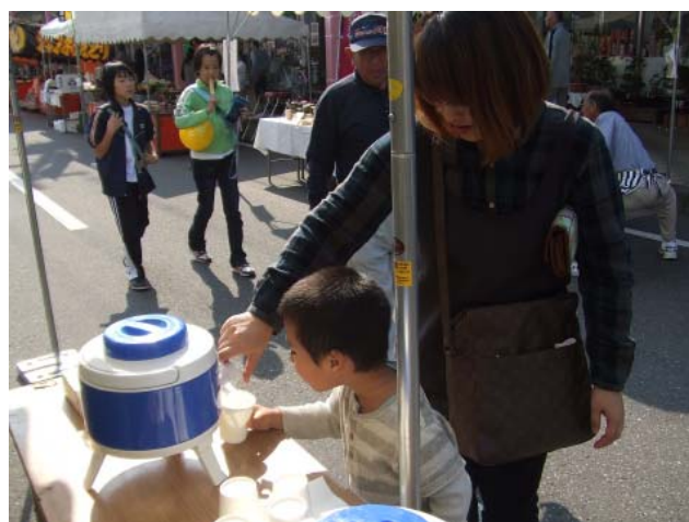
「ぼくも水飲みたい」