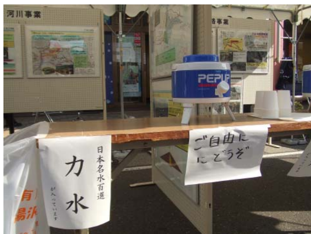
なぜか「カ水」を置いたら → ↓