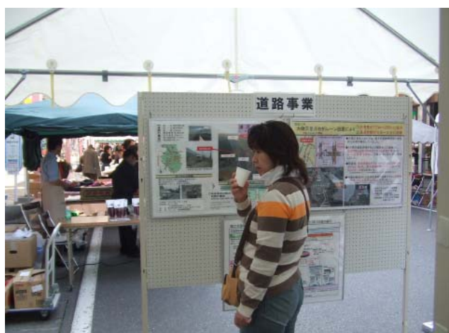
「カ水」を飲みながら