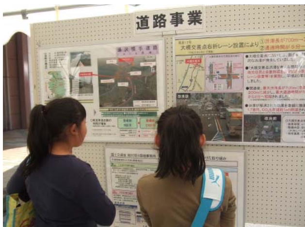
☆ 見入っています。へえーこうなるんだ ☆