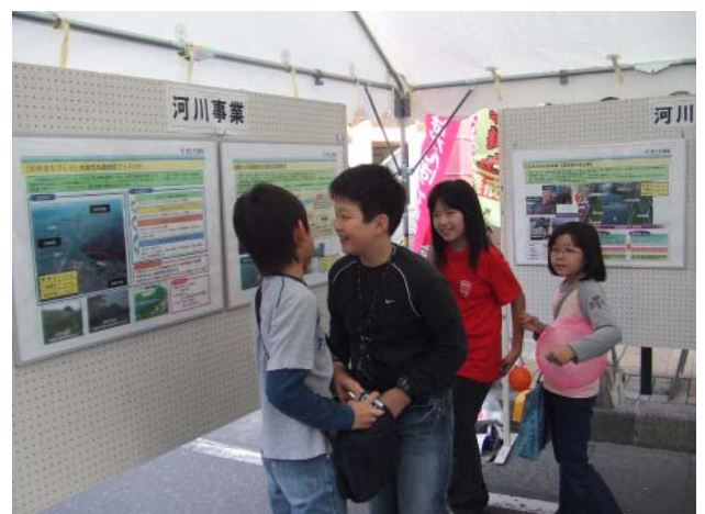
☆ 裏は道路のパネルだってよ ☆