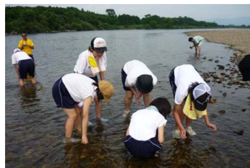
水生生物を捕獲中