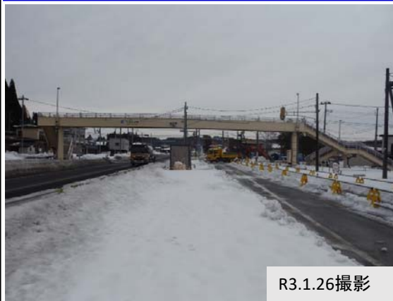
④ 和田地内(大仙市方向)