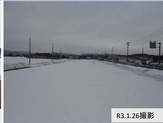
① 岡村地内(大仙市方向)