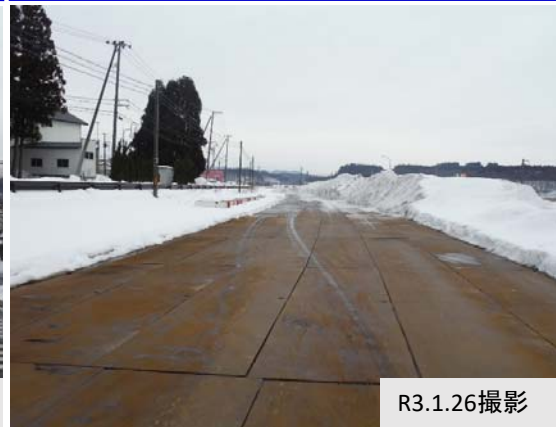
② 岡村地内(大仙市方向)