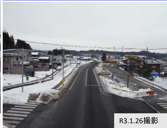
③ 下夕川原地内(大仙市方向)