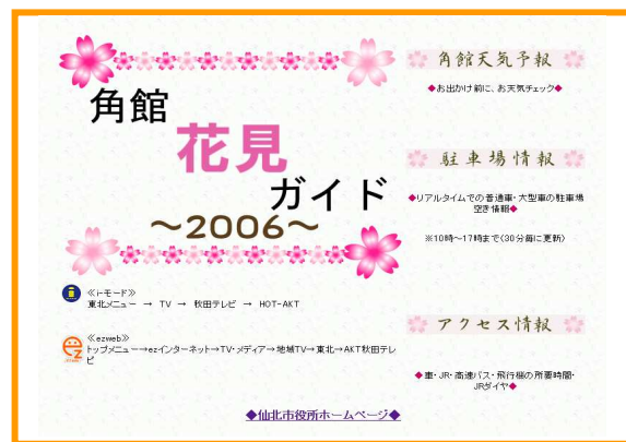
▲ホームページ(交通・駐車場の情報提供)