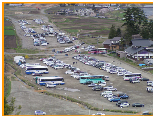
▲角館Pのバス用地を活用した臨時駐車場