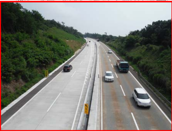
④ 雄物大橋より終点側を望む