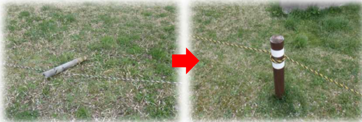
《仁井田運動公園》 腐食し折れた杭の交換