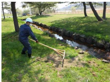
水路脇のぬかるみ表土入替

4月15日 利用者が増える事が予想されるゴールデンウィーク前に、水辺の広場・割山散策路などを施設管理者と合同で安全利用点検を実施しました。危険箇所がないか、目視で確認し応急処置を含む改善処置を行いました。