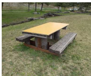
腰掛け枕木・テーブルのがたつきを修繕