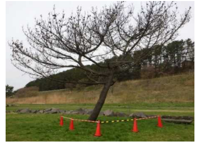
枯れた松の木の接近防止柵設置