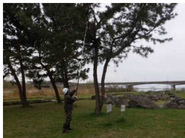
松の木の折れた枝の撤去