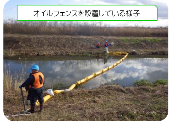
オイルフェンスを設置している様子