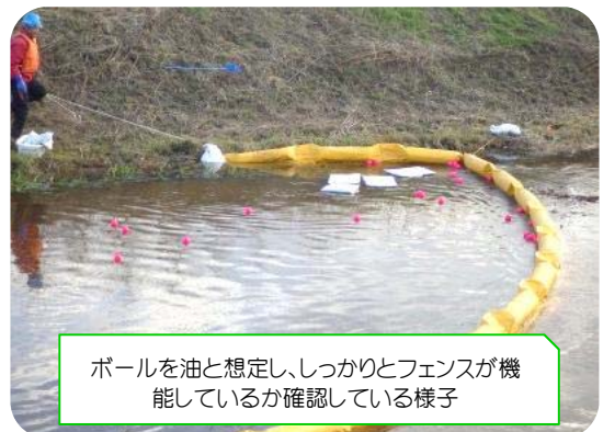
ボールを油と想定し、しっかりとフェンスが機能しているか確認している様子

油事故が発生させた原因者はその回収や処理の費用を負担しなければなりません。原因者にならないためにも、日頃のホームタンクのチェックや給油には十分に気をつけましょう。